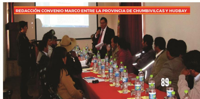
REDACCIÓN CONVENIO MARCO ENTRE LA PROVINCIA DE CHUMBIVILCAS Y HUBBAY