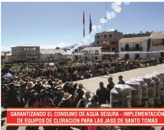
GARANTIZANDO EL CONSUMO DE AGUA SEGURA - IMPLEMENTACIÓN DE EQUIPOS DE CLORACIÓN PARA LAS JASS DE SANTO TOMÁS