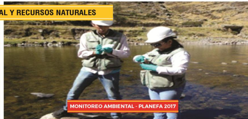
MONITOREO AMBIENTAL - PLANEFA 2017