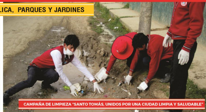
CAMPAÑA DE LIMPIEZA "SANTO TOMÁS, UNIDOS POR UNA CIUDAD LIMPIA Y SALUDABLE"