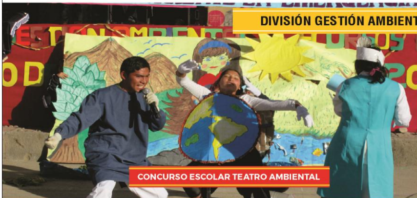
CONCURSO ESCOLAR TEATRO AMBIENTAL