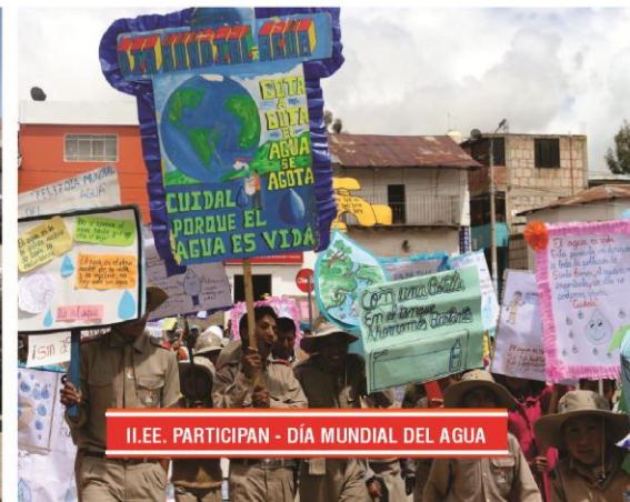
I.L.E.E. PARTICIPAN - DÍA MUNDIAL DEL AGUA