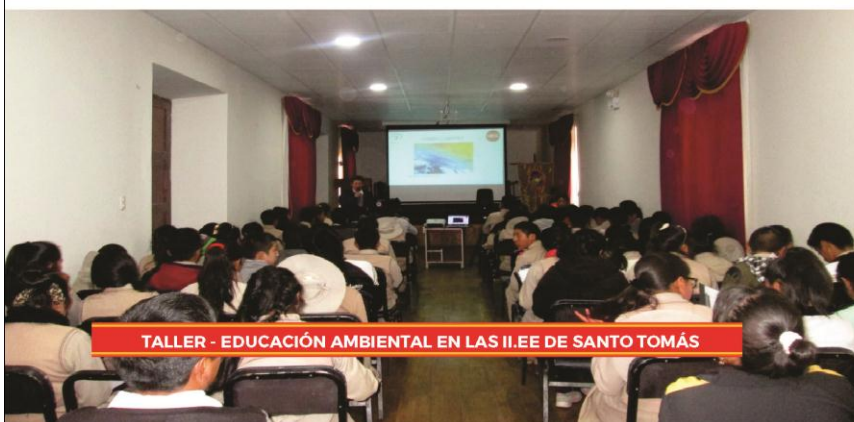
TALLER - EDUCACIÓN AMBIENTAL EN LAS II.EE DE SANTO TOMÁS