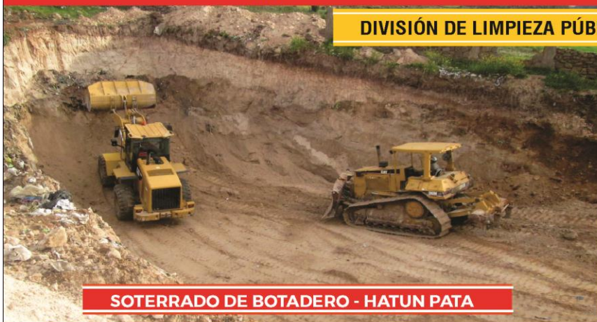
SOTERRADO DE BOTADERO - HATUN PATA