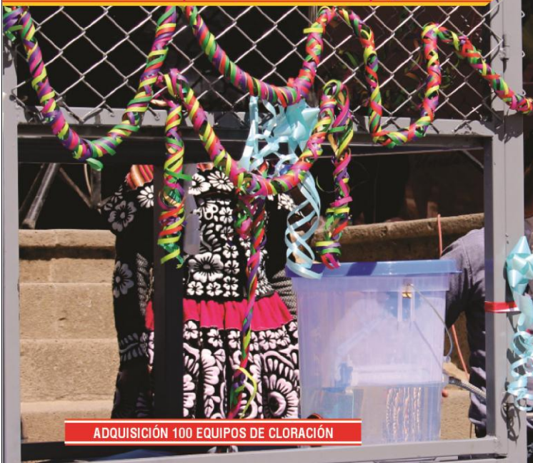
ADQUISICIÓN 100 EQUIPOS DE CLORACIÓN